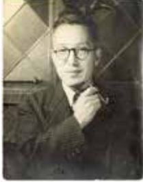
海野十三 作家デビューの頃

「日本SFの父」とも呼ばれる海野十三(1897~1949)は、戦前から戦後にかけて数々の空想科学小説で人気を博しました。手塚治虫や小松左京らSF第一世代の作家も、幼少期は海野の愛読者でした。真空管開発の技術者だった海野は、1928年に「電気風呂の怪死事件」でデビューし、異色の探偵作家として知られるようになります。以後、少年向けの科学冒険小説を開拓しつつ、ロボット、ロケット、人工臓器、化学兵器、宇宙戦争、タイムトラベルなど、多様なテーマを科学者の知見に基づくリアルな筆致で描きました。本展では、海野十三の軌跡を辿り、同じく世田谷に住んだ横溝正史や小栗虫太郎との交流、海野の影響を受けた手塚治虫、小松左京、星新一らの仕事も紹介し、マンガ、アニメ、ゲームへと広がる日本SFの想像力の源流に迫ります。