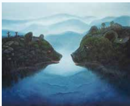
《Heart To Face》永沢碧衣