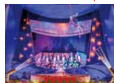
ムットーニ《サーカス》(2019年)特別出品