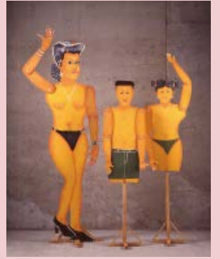
「マネキン」 国：ガーナ、地域：アクラ 1995年収集