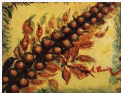
セラフィヌ・ルイ(枝)1930年

開館30周年記念 コレクションの5つの物語 芸術百華 開催中～2017年1月29日(日) 1階展示室