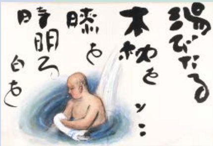
画：水木伸一、書：河東碧梧桐《碧水帖 上州ぬる湯の記》1932年

絵と文学は別のジャンルの表現と考えがちですが、歴史をさかのぼってみると、絵と文学はいつも近い関係にあったことに気づきます。