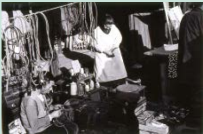
桑原甲子雄《電蓄》(世田谷ボロ市)より 1936年