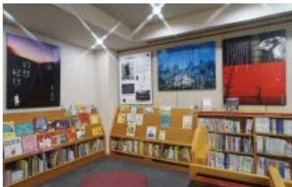
「どこでも文学館」展示風景

世田谷文学館は全館改修工事のため、2017年4月21日(金)(予定)まで休館しております。 休館中は館外での出張展示やワークショップ、講座等を行います。