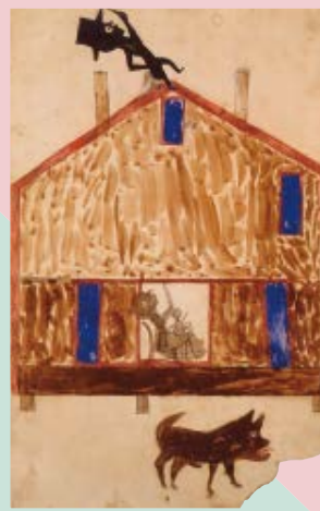
ビル・トレイラー《人と犬のいる家》1939-49年