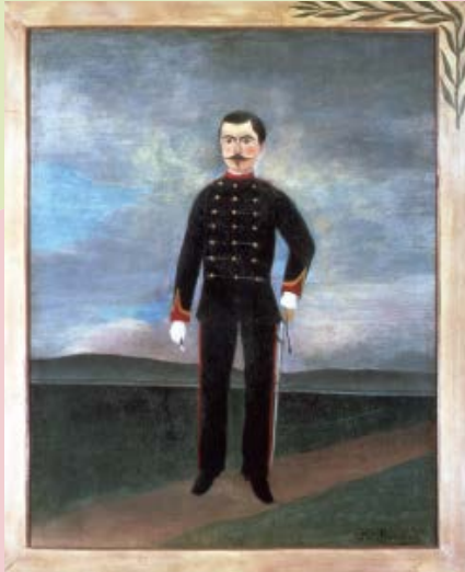
アンリ・ルソー《フリュマンヌ・ピッシュの肖像》1893年頃

現在では美術史に名を刻んでいるフランスの素朴派。自分が描きたいものを自分の思いのままに描く、という私だけの物語が、地域や時代を超え多くの人々を魅了しています。