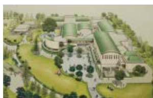
美術館設計時の竣工イメージ

1986年に開館した世田谷美術館。約1万6千点の所蔵品から、この年に制作された作品を集め、当時の社会と美術の動向を考察します。小コーナーでは、「食と器」と題して北大路魯山人の作品を紹介いたします。 ¥一般200(160)円/高校・大学生150(120)円/65歳以上、小・中学生100(80)円 ※( )内は20名以上の団体料金 ※障害者割引あり ※企画展チケットでご覧いただけます