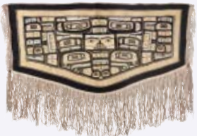
北海道立北方民族博物館蔵 「シロイワヤギ毛製外套(チルクットローブ)」

企画展 7つの海と手しごと vol.7 「北太平洋と 北西海岸先住民のトーテム」 開催中～12月18日(日) 月曜休み 11:00～19:00 3F生活工房ギャラリー&生活工房4F