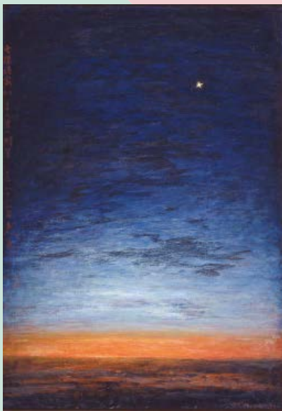
小堀四郎《無限静寂(宵の明星一信)》1977年

私をとりまく世界はどれほどの大きさなのでしょう。そして私の内なる世界もまた広大な気がしてなりません。