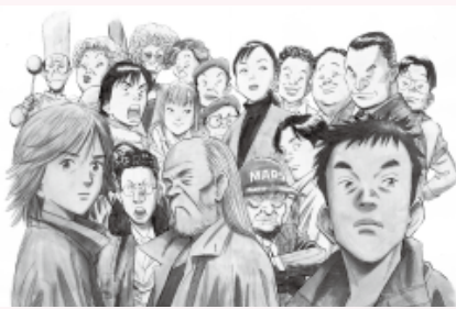
『20世紀少年』©浦沢直樹・スタジオナッツ/小学館

一般800(640)円/65歳以上、高校・大学生600(480)円/小・中学生300(240)円 ※( )内は20名以上の団体料金 ※障害者割引あり