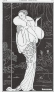
ジュール・バルビエ『パリの服装 パール刺繍の白いベルベットのコート 白のダマスク織のドレス 淡いバラ色の靴』『ジュルナル・デ・タム・エ・デ・モード』1913年10月10日 神戸ファッション美術館蔵

西洋服飾史研究家・石山彰氏(1918-2011)のコレクションを中心に、16世紀から20世紀初頭にかけての服飾史研究書やファッション・ブックとファッション・プレート、および明治時代の錦絵をご紹介します。