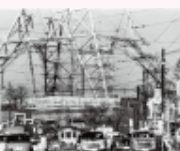
林忠彦(東京タワー建設) 1958(昭和33)年 個人蔵

一般1,000(800)円/65歳以上、高校・大学生800(600)円/小・中学生500(300)円 ※( )内は20名以上の団体料金 ※障害者割引あり ※リピーター割引(会期中)あり