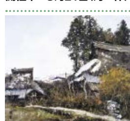
《比良春雪》 [京都府京都市左京区大原]1970年