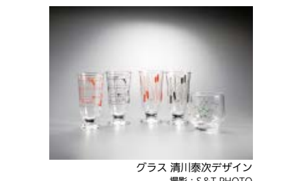
ガラス 清川泰次デザイン 撮影: S&T PHOTO

清川泰次記念ギャラリー・区民ギャラリー (観覧無料) 開催中~2/28 山中未有 彫刻展 3/1~6 みちくさ陶房展 3/8~13 小田公子 個展 ※9日10:00から公開 3/15~20 駒29会展 ※公開は初日の午後から、最終日は16:00頃終了(ただし、主催者により公開時間は異なります)