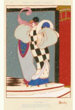
シャルル・マルタン(雪) 『モード・エ・マニエル・ドージュルデュイ』 1913年、パリ、神戸ファッション美術館蔵

ファッション史の楽しみ —石山彰ブック・コレクションより— 開催中~4月10日(日) 1階展示室