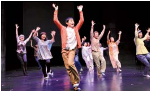
2015年発表会の様子

区内外からの参加者たちが、演劇づくりに取り組む「地域の物語」ワークショップ。今年は「女性であること」をテーマに、参加者が女性として生きてきた中で得た様々な体験や感情に向き合い、共有してきました。3か月間のワークショップの最後に、考えてきたことを演劇形式で発表します。同じ時代を生きる人々の声を通じて、自分と切り離すことのできない「生と性」について考えてみませんか?