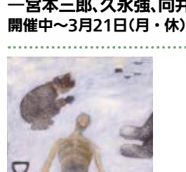
久永強 《戦友(とも)を送る・冬》 1992年