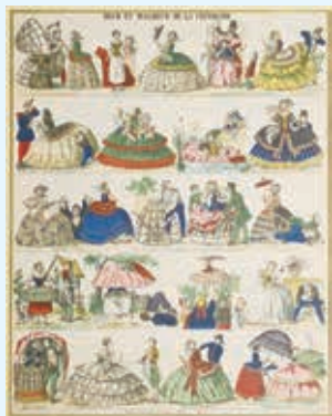
《クリノリンの不幸》1858年頃

西洋服飾史研究家・石山彰氏(1918~2011)のコレクションを中心に、16世紀から20世紀初頭にかけての服飾史研究書やファッション・ブックとファッション・プレート、および明治時代の錦絵をご紹介します。