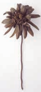
《花(菊)》1890~1900年頃 パレンシア現代美術館蔵

スペインの彫刻家 フリオ・ゴンサレス —ピカソに鉄彫刻を教えた男 開催中~1月31日(日) 1階展示室