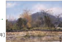
《古壁の秋》 [奈良県奈良市高畑町福井] 1971年