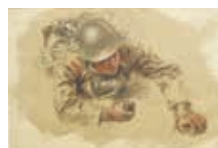
《南苑攻撃図》下絵 1941年頃

画家と写真家のみた戦争 —宮本三郎、久永強、向井潤吉、師岡宏次 開催中~3月21日(月・休)